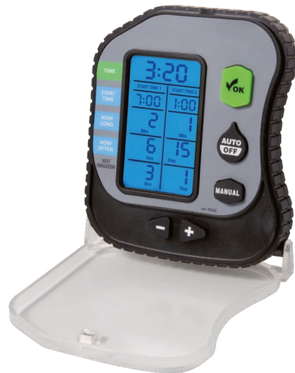
B - Programador submersível digital Série PLUS PRO - 1, 2 e 4 estações