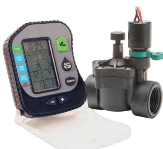
A - Kit programador PLUS PRO + eletroválvula RN-101 FF 1" - 1 estação