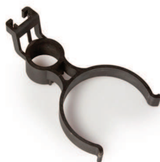
Suporte para caixas Cudell incluído